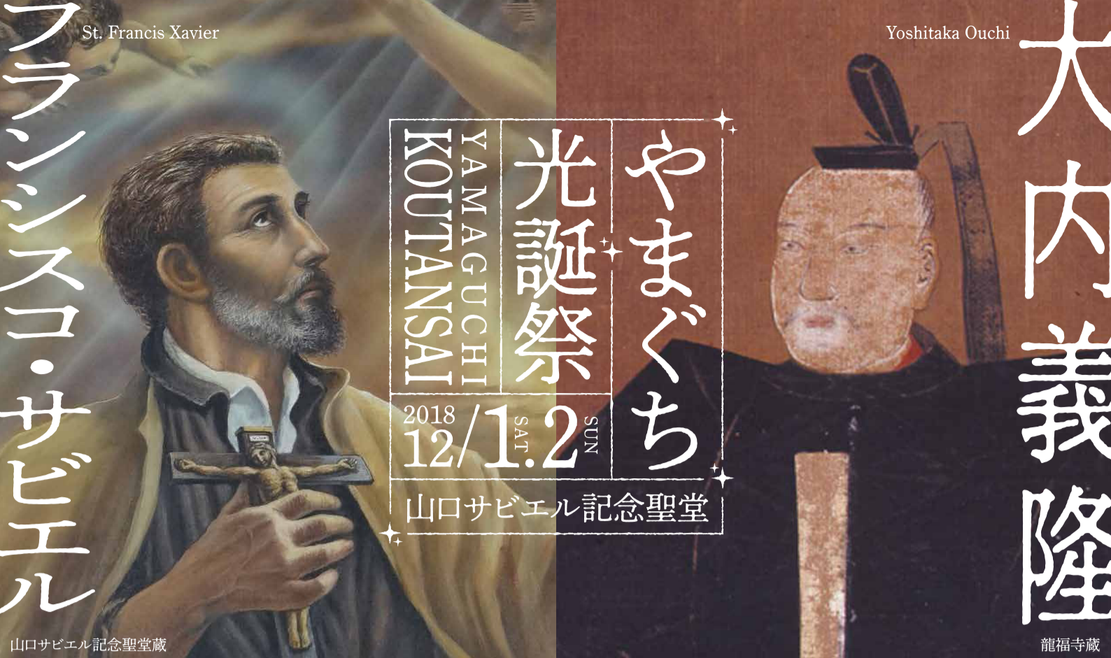
山口サビエル記念聖堂蔵